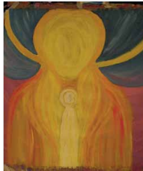
De hotfulla demonerna blev en ängel.